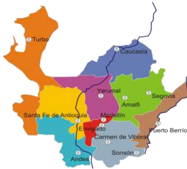
Ilustración 1. Ubicación geográfica sedes y seccionales del programa de regionalización de la Universidad de Antioquia.

"Revista Virtual Universidad Católica del Norte". No. 35, (febrero-mayo de 2012, Colombia), acceso: [ http://revistavirtual.ucn.edu.co/ ], ISSN 0124-5821 - Indexada Publindex-Colciencias (B), Latindex, EBSCO Information Services, Redalyc, Dialnet, DOAJ, Actualidad Iberoamericana, Índice de Revistas de Educación Superior e Investigación Educativa (IRESIE) de la Universidad Autónoma de México.