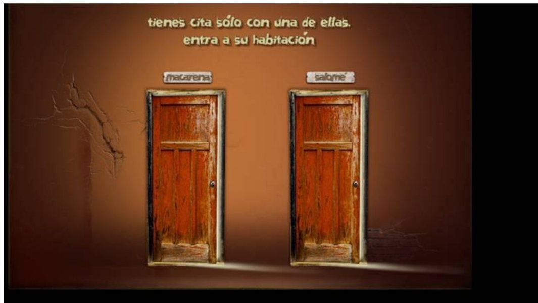
Fotograma de la página web: elsecretodevanessa.com

"Revista Virtual Universidad Católica del Norte". No. 34, (septiembre-diciembre de 2011, Colombia), acceso: [ http://revistavirtual.ucn.edu.co/ ], ISSN 0124-5821 - Indexada Publindex-Colciencias (B), Latindex, EBSCO Information Services, Redalyc, Dialnet, DOAJ, Actualidad Iberoamericana, Índice de Revistas de Educación Superior e Investigación Educativa (IRESIE) de la Universidad Autónoma de México.