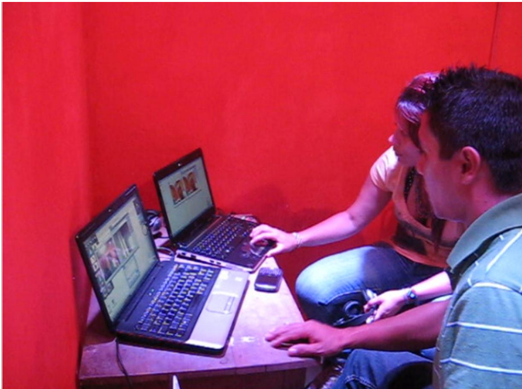
Ensayo de las interfaces

"Revista Virtual Universidad Católica del Norte". No. 34, (septiembre-diciembre de 2011, Colombia), acceso: [ http://revistavirtual.ucn.edu.co/ ], ISSN 0124-5821 - Indexada Publindex-Colciencias (B), Latindex, EBSCO Information Services, Redalyc, Dialnet, DOAJ, Actualidad Iberoamericana, Índice de Revistas de Educación Superior e Investigación Educativa (IRESIE) de la Universidad Autónoma de México.