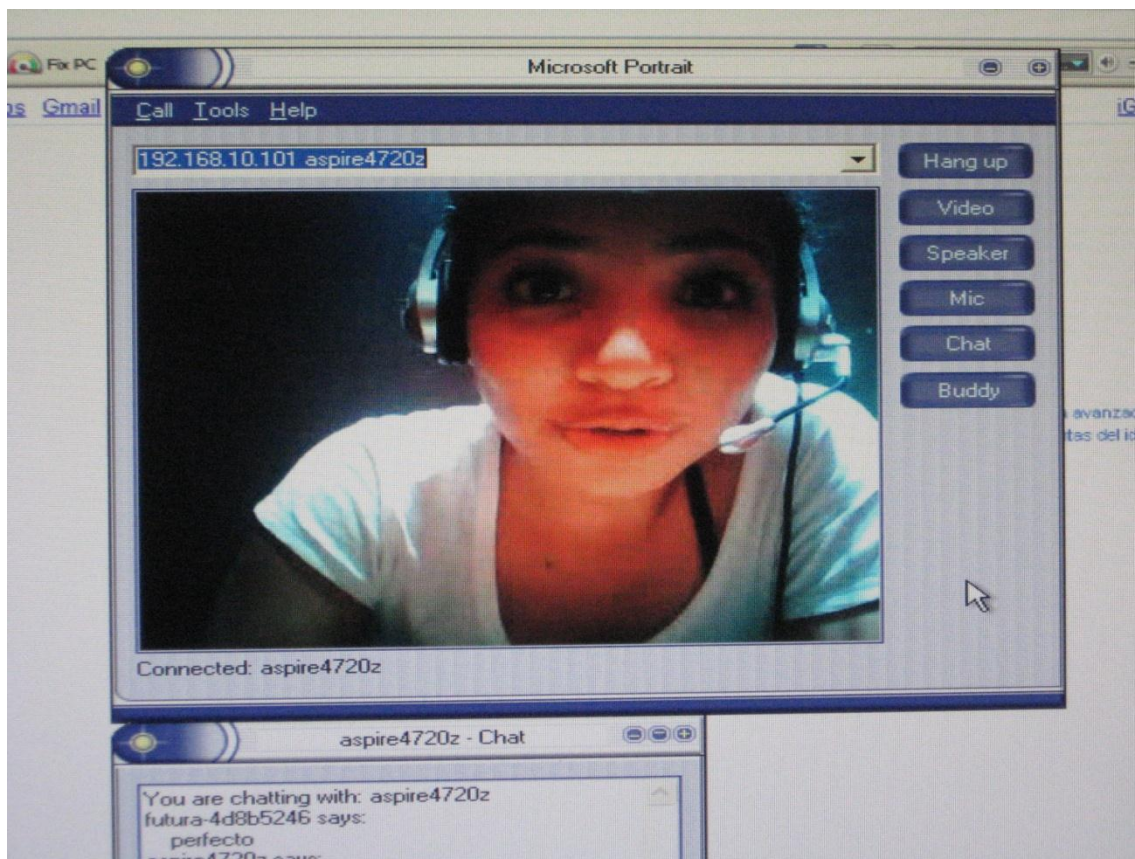
Vanessa en interacción

"Revista Virtual Universidad Católica del Norte". No. 34, (septiembre-diciembre de 2011, Colombia), acceso: [ http://revistavirtual.ucn.edu.co/ ], ISSN 0124-5821 - Indexada Publindex-Colciencias (B), Latindex, EBSCO Information Services, Redalyc, Dialnet, DOAJ, Actualidad Iberoamericana, Índice de Revistas de Educación Superior e Investigación Educativa (IRESIE) de la Universidad Autónoma de México.