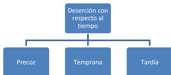
Cuadro 1. Tipos de deserción con respecto al tiempo. Fuente: Adaptación de Tinto (1989).

"Revista Virtual Universidad Católica del Norte". No. 33, (mayo-agosto de 2011, Colombia), acceso: [ http://revistavirtual.ucn.edu.co/ ], ISSN 0124-5821 - Indexada Publindex-Colciencias (B), Latindex, EBSCO Information Services, Redalyc, Dialnet, DOAJ, Actualidad Iberoamericana, Índice de Revistas de Educación Superior e Investigación Educativa (IRESIE) de la Universidad Autónoma de México. [pp. 328 – 355]